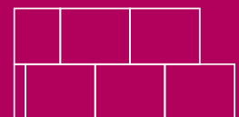
Exemple de montage en angle avec croisement des carreaux