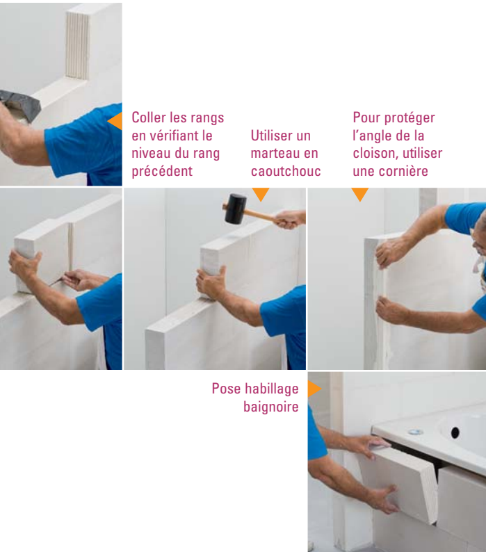
Coller les rangs en vérifiant le niveau du rang précédent

Quand la cloison est terminée, l'espace de 0,5 cm doit être rempli de mousse de polyuréthane. Pour plus d'informations techniques (hauteur maximale des parois par exemple), l'internaute se référera à www.siporex.fr